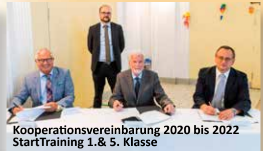
Kooperationsvereinbarung 2020 bis 2022 StartTraining 1.& 5. Klasse