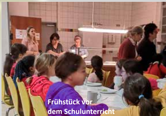
Frühstück vor dem Schulunterricht