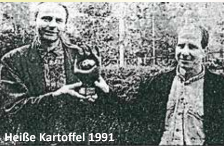
Heiße Kartoffel 1991