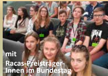
mit Racas-Preisträger- Innen im Bundestag